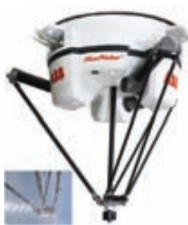
ABB FRANCE-DIVISION ROBOTIQUE

Le robot pick & place IRB 360 FlexPicker est proposé en version IP69K pour répondre aux exigences d'hygiène de l'industrie alimentaire : cet indice d'étanchéité le rend compatible avec les produits de lavage et les détergents agressifs utilisés lors des phases de Nettoyage En Place (NEP). Il est construit avec des matériaux résistants à la corrosion, tous ses composants sont scellés pour garantir l'étanchéité et ses bras sont recouverts d'une peinture spéciale là où c'est nécessaire. Il est en outre le seul robot delta du marché à posséder un 4e axe en acier inoxydable apte à manipuler directement des produits alimentaires tels que viandes, produits laitiers, plats préparés, etc. Puissant et rapide, il peut manier des pièces jusqu'à 3 kg à une cadence record de 110 prises par minute. Le robot intègre le système de vision PickMaster qui permet de contrôler avec précision la coordination des prises à haute vitesse et d'identifier les produits défectueux.